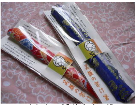
イベントロゴ入りパッケージ

社名やロゴなどを入れる事で、より自分たちの活動として自覚・宣伝することが可能です。 ノベルティや記念品などにもばっちりです！